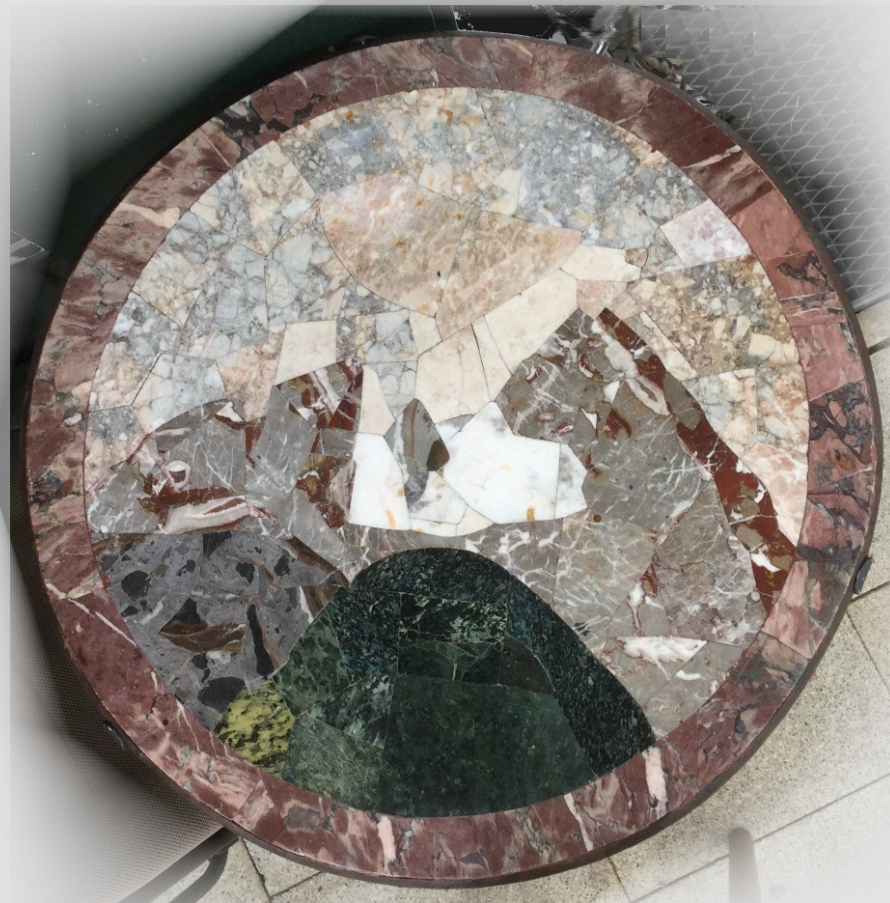
Marmor-Intarsia-Arbeit (Tischplatte) Josef Lackner um 1960

es da schon, aber keine Toilette. Er hat sich, wenn's pressiert hat, mit einem Eimer beholfen und ansonsten das Klo der "Hasein" benutzn dürfen.)